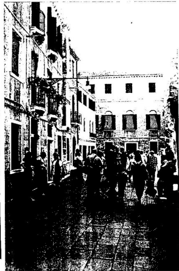
Interno di casa Rizzi, durante la meritata sosta, e ripresa del tour pomeridiano in Calle larga de le Chigvere.