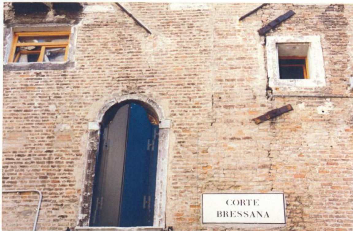
Il "clou" della giornata: la visita alla CORTE BRESSANA sul lato della bellissima chiesa dei SS. Giovanni e Paolo.