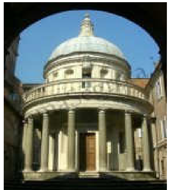
Il Tempietto del Bramante

Al centro del chiostro si innalza il bellissimo Tempietto del Bramante , sorto proprio sul luogo dove la leggenda vuole che sia stato crocifisso S.Pietro.