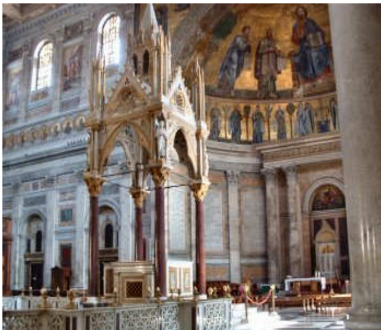
Il ciborio di Arnolfo di Cambio