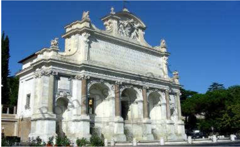
La monumentale fontana del Gianicolo (più nota con la denominazione di "Fontanone")