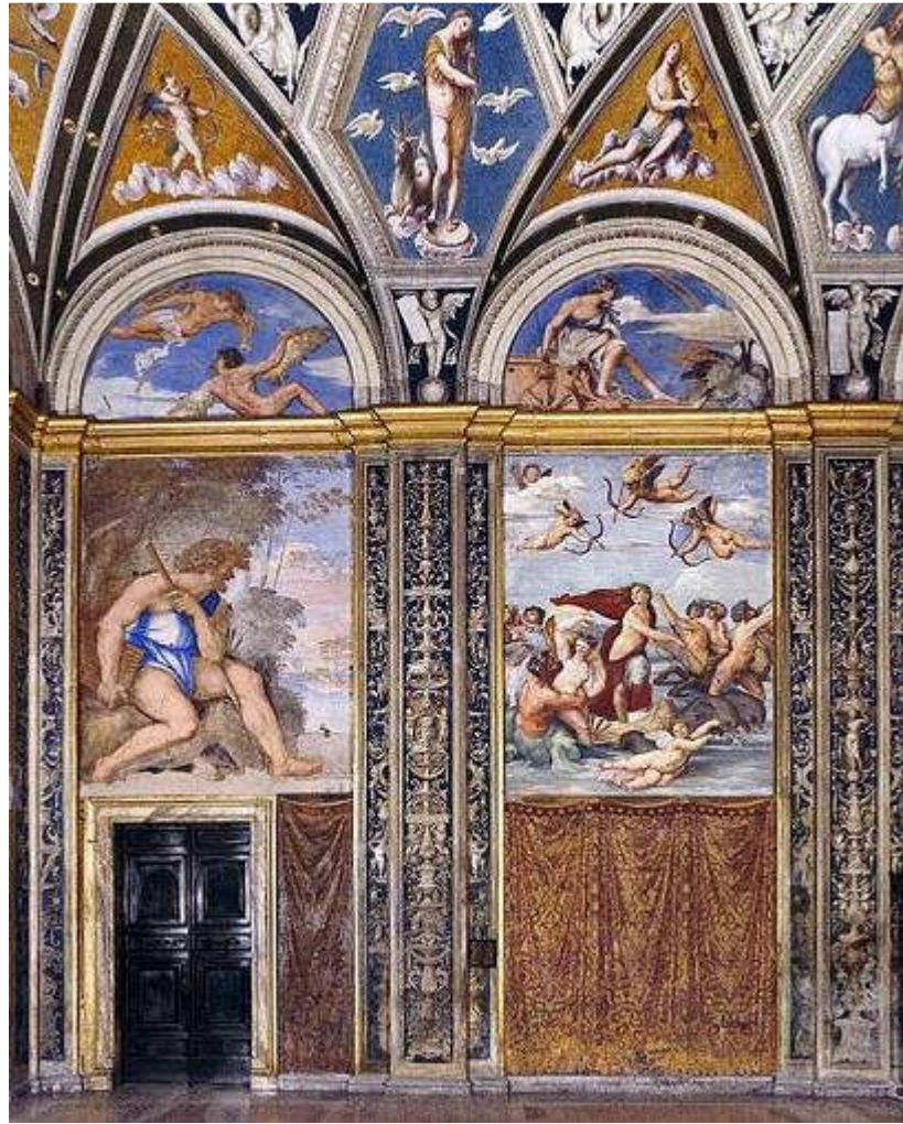
Il trionfo di Galatea nella Sala di Galatea