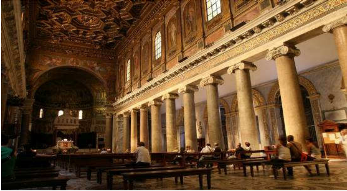
interno della Basilica di Santa Maria in Trastevere