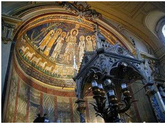
Ciborio e Abside