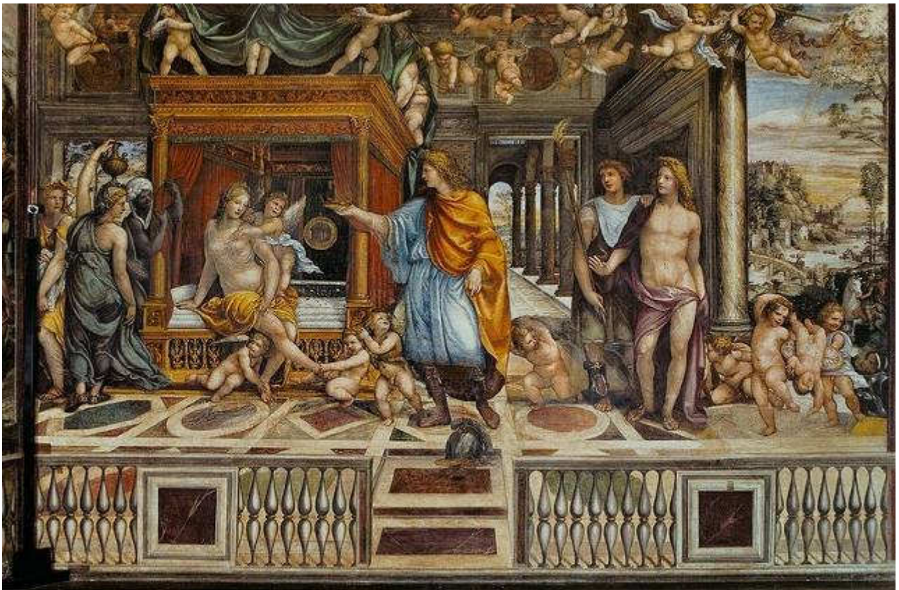
sodomaNozze di Alessandro e Rossane