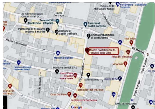
MAST Museo della Città via A.Botturi 3 – CASTEL GOFFREDO (Mn)