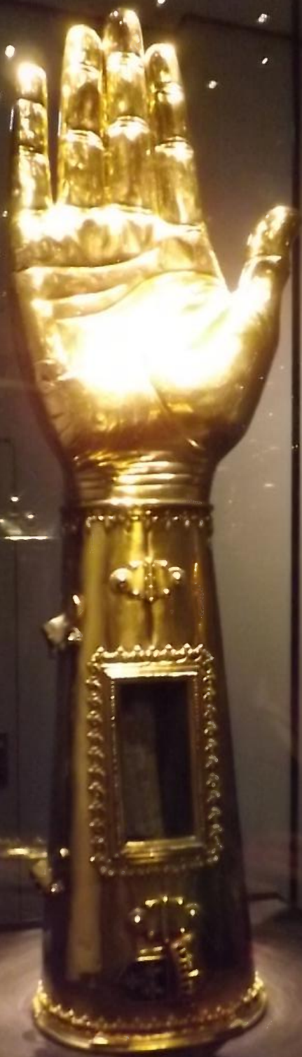
Hand of the Virgin Mary 15th century The Hand of the Virgin Mary 15th century The Hand of the Virgin Mary 15th century