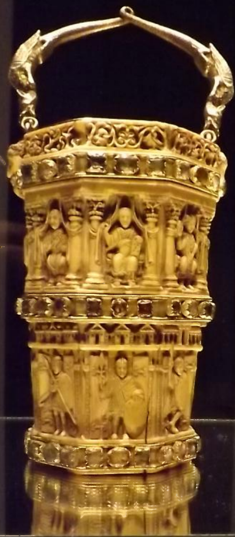
Weihwassersitula Mittelrhein, um 1000